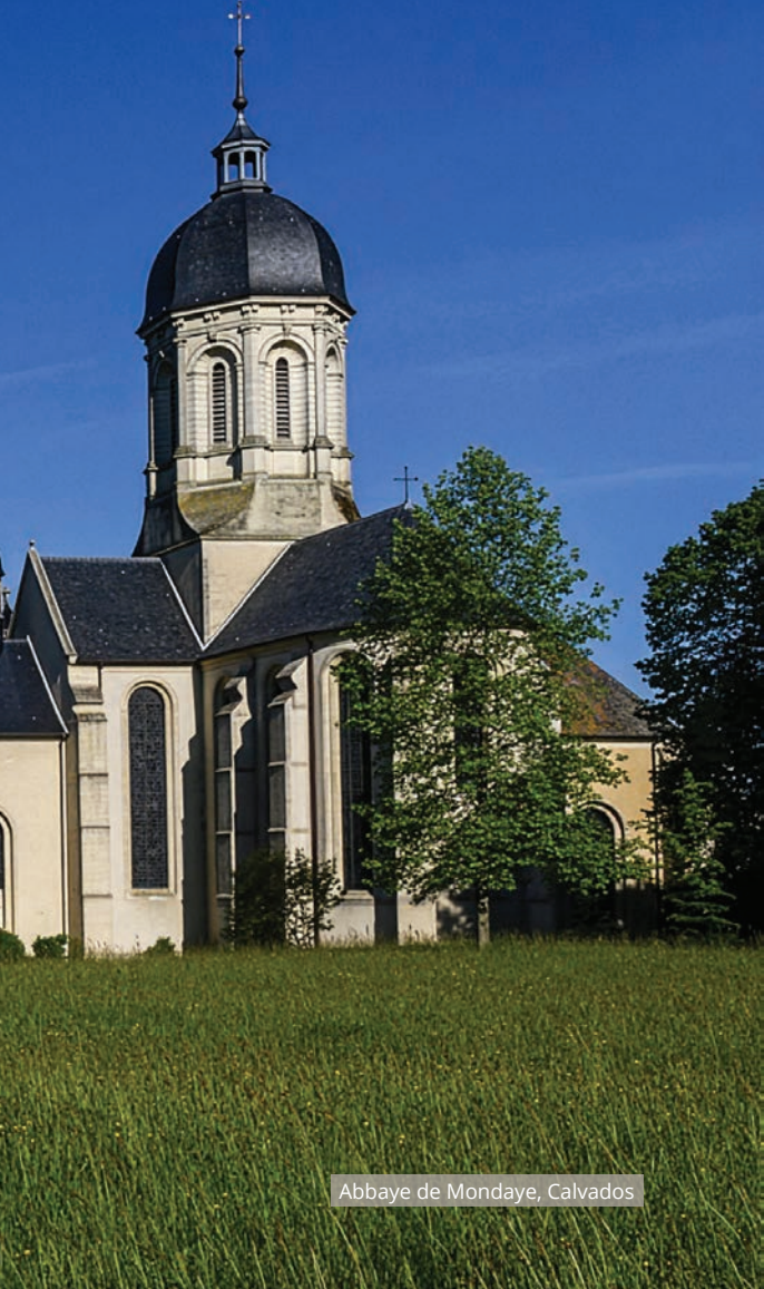
Abbaye de Mondaye, Calvados