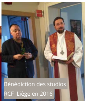
Bénédictio des studios RCF Liège en 2016