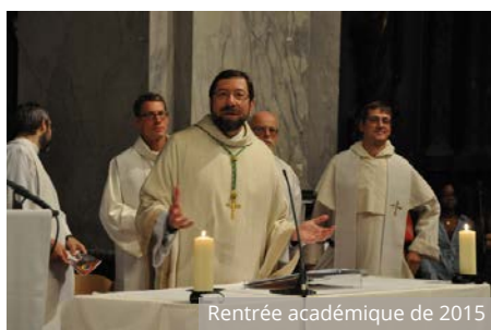
Rentrée académique de 2015

Ordonné prêtre le 6 septembre 1980 à Liège, il a enseigné la théologie fondamentale et l'histoire de l'Église à partir de 1982 au Séminaire de Liège et à l'ISCP. À Louvain-la-Neuve, il a été président du Séminaire Saint-Paul (1993-2005), puis président du Collège Saint-Paul, qui accueille les prêtres étudiant à l'UCL (2005-2013). Il a été nommé chargé de cours à l'UCL à partir de 1996, puis professeur d'histoire du christianisme en 2002 et professeur ordinaire en 2010. Il est l'auteur de nombreuses publications en matière d'histoire de l'exégèse biblique et d'histoire du diocèse de Liège. Il a aussi été porte-parole des évêques de Belgique entre 1996 et 2002.