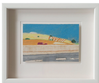
© Marcel Warrant - Le ciel bleu

C'est dans cet esprit que nous vous espérons nombreux à la Foire aux croûtes organisée au coeur de Namur, du 13 au 16 octobre 2023.