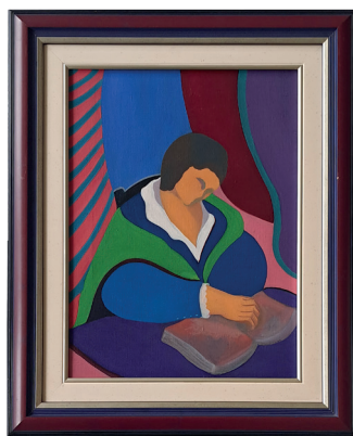
© Claudine Levêque - La lectrice