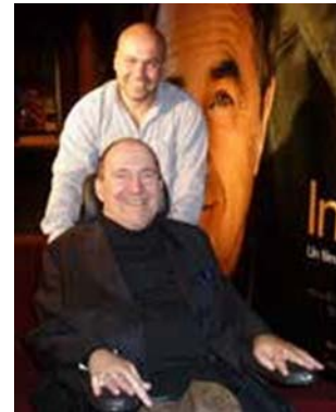
Philippe Pozzo di Borgo

“ Dans le bruit médiatique qui m’est tombé dessus à la sortie d’« Intouchables », les gens qui avaient un peu de constance et de consistance, je les ai rencontrés chez RCF. J’étais déjà venu les voir il y a 11 ans et quelques mois avant la sortie du film. Il semblerait que RCF ait un 6e sens! Ils sentent les émergences avant les autres. Ils ont une sensibilité, qui fait qu’ils attrapent l’air du temps et ça me touche . ”